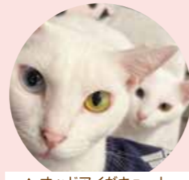
▲オッドアイがキュート