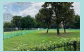
▲中型・小型犬ゾーン