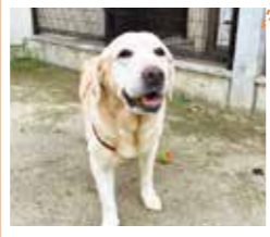
ゴン太(推定10歳、オス、30kg)